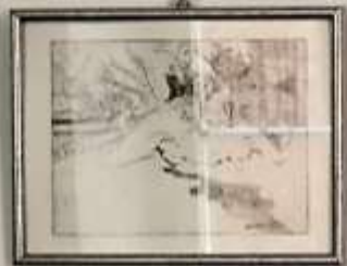
1911-1912 Royal Institution Birmingham, UK