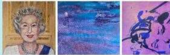
Anfahrt & Lageplan Palais im Stadtpark