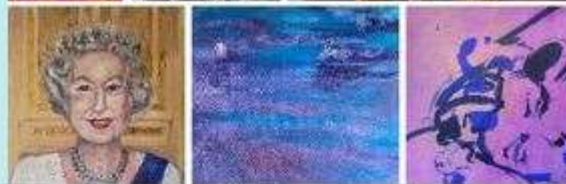
Anfahrt & Lageplan Palais im Stadtpark