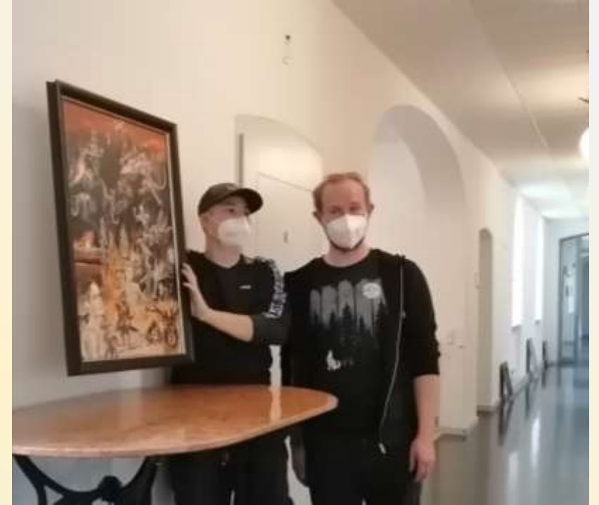
Beim Ausstellungsaufbau am Montag, den 26. September 2022