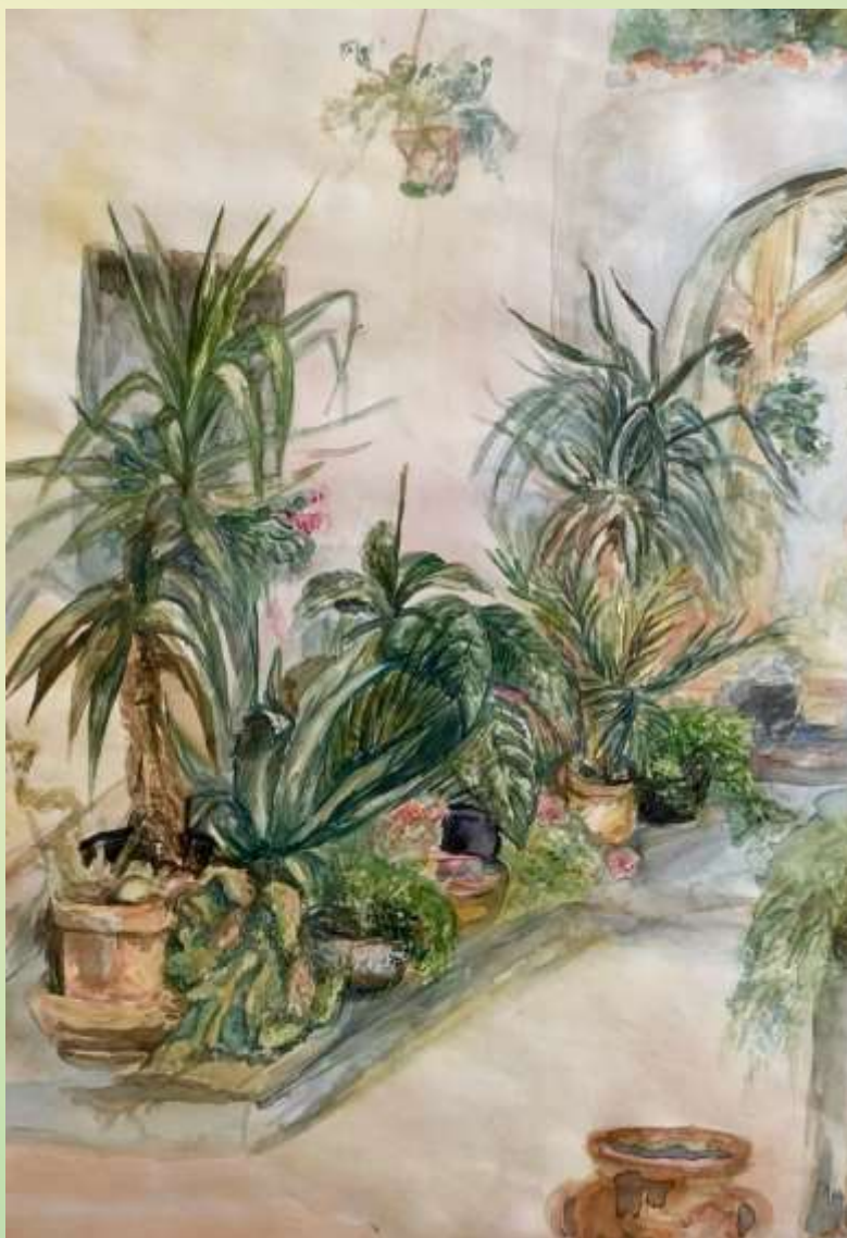
Im Garten von Tante Lilo Aquarell (1987), Holzrahmen, 30 x 40 cm – unverkäuflich