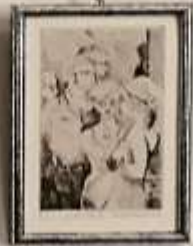
1911-1912 Royal Institution Birmingham, UK