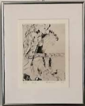
1911 Royal Institution Birmingham, UK