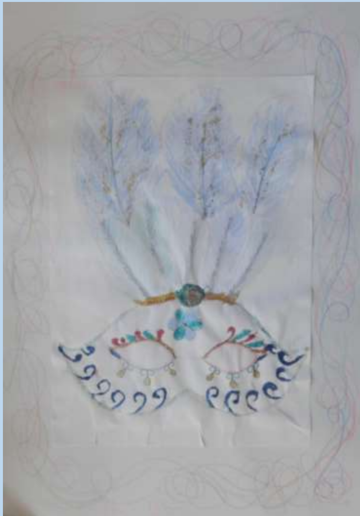
„Venedig“ Soo-Mi Kim (3. / 4. Klasse)