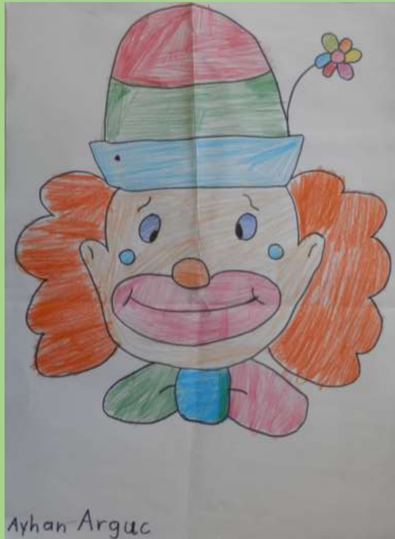
„Maske“ Ayhan Arguc (1. / 2. Klasse)