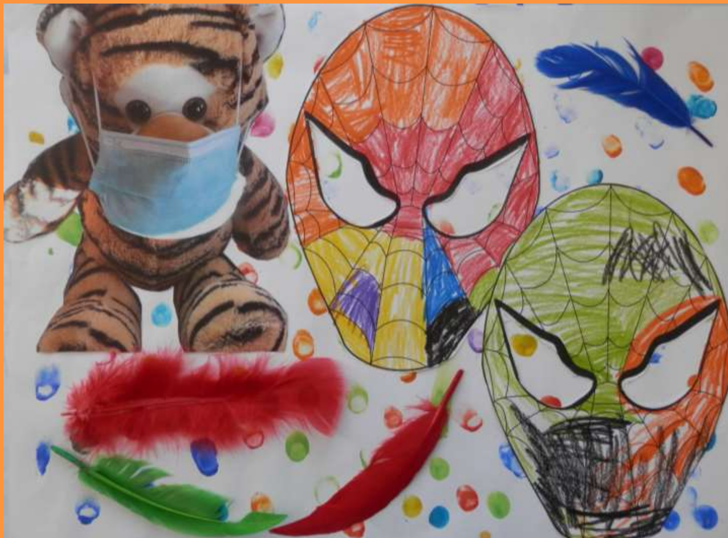
„Masken“ Jan-Lukas (1. / 2. Klasse)