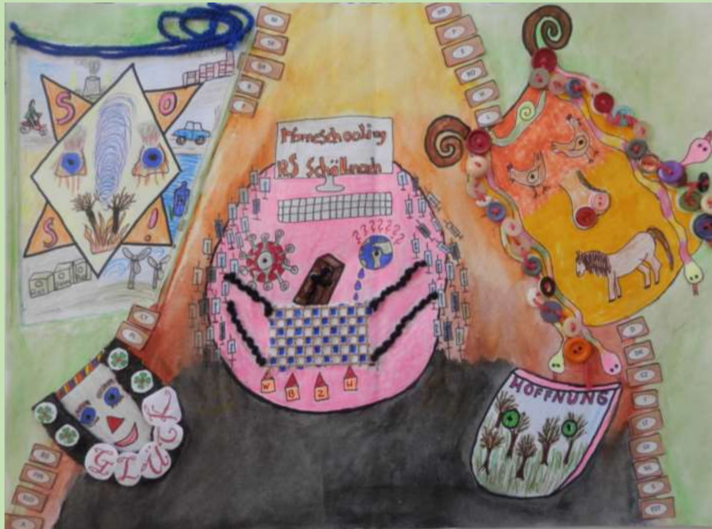
„Angst und Zuversicht“ Alexandra Viktoria Scheungraber (5. / 6. Klasse)