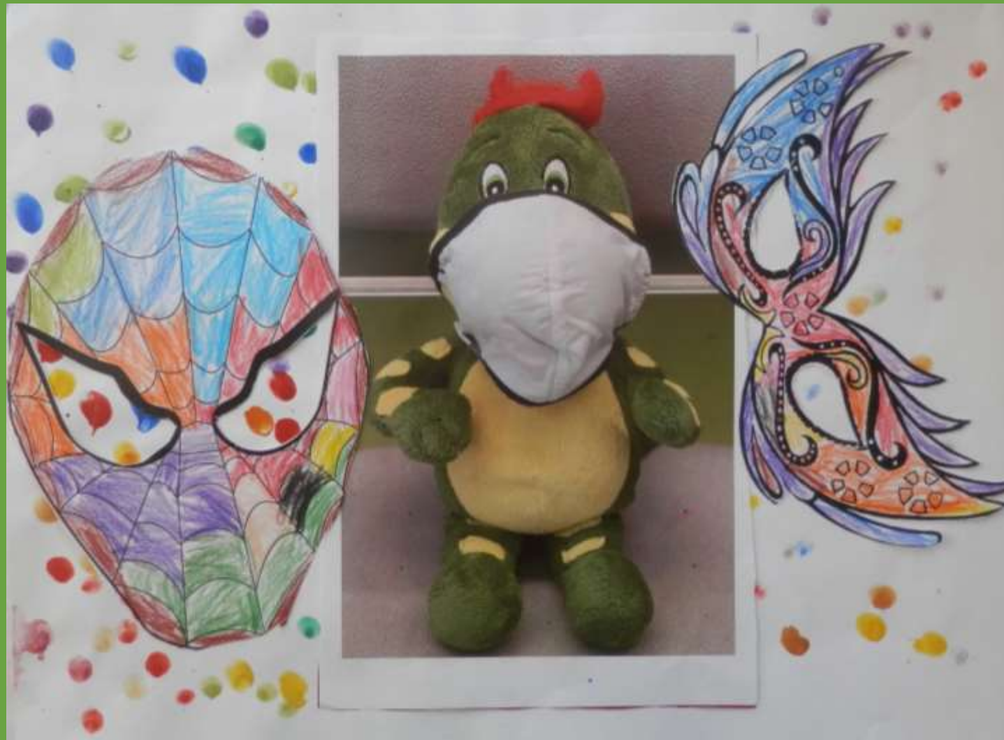
„Masken“ Philip Damböck (1. / 2. Klasse)