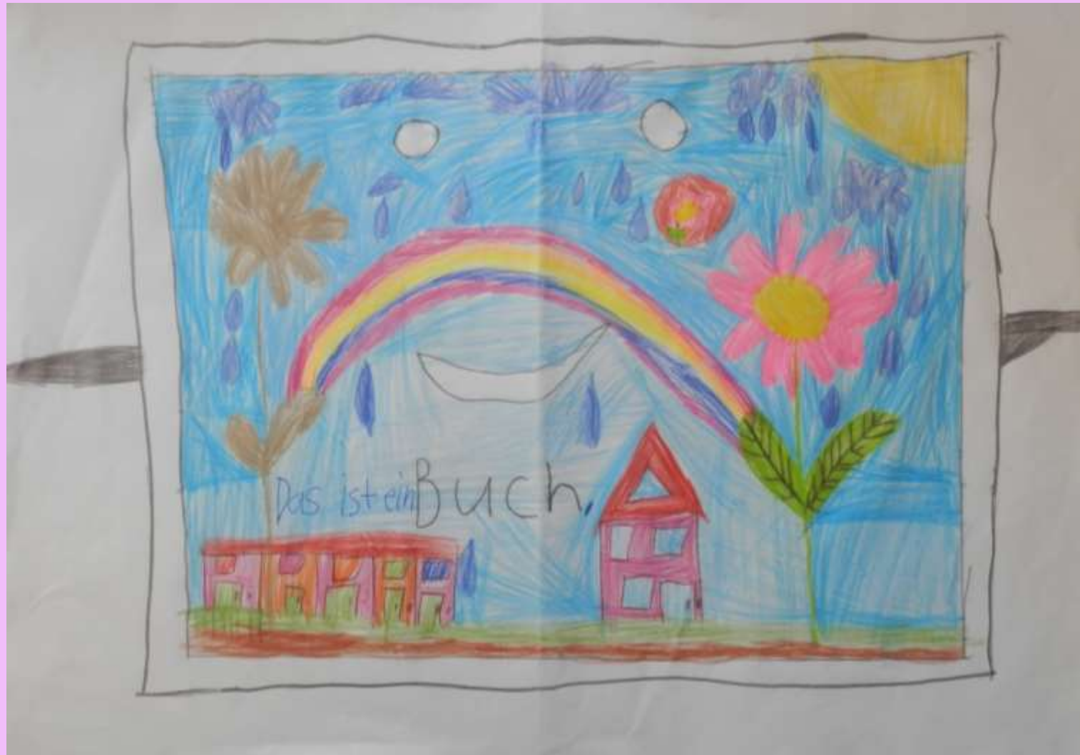
„Die Buchmaske“ Lorena Hanauer (1. / 2. Klasse)