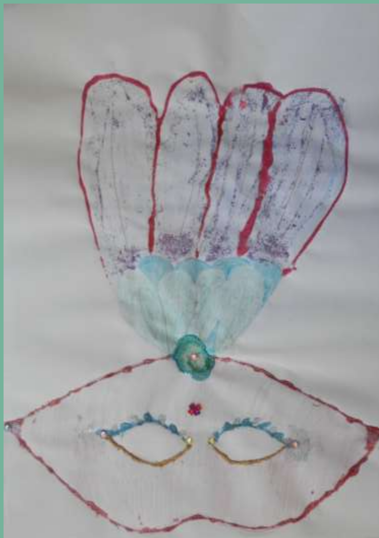
„Venedig“ Soo-Mi Kim (3. / 4. Klasse)