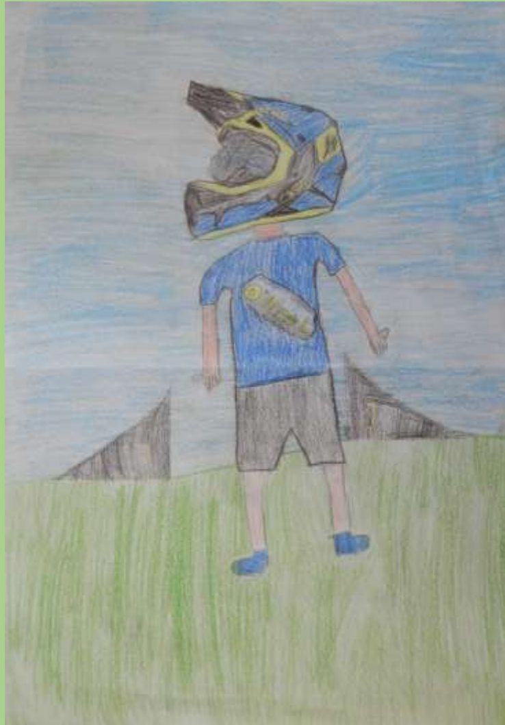
„The Biker“ Jannik Schosser (5. / 6. Klasse)