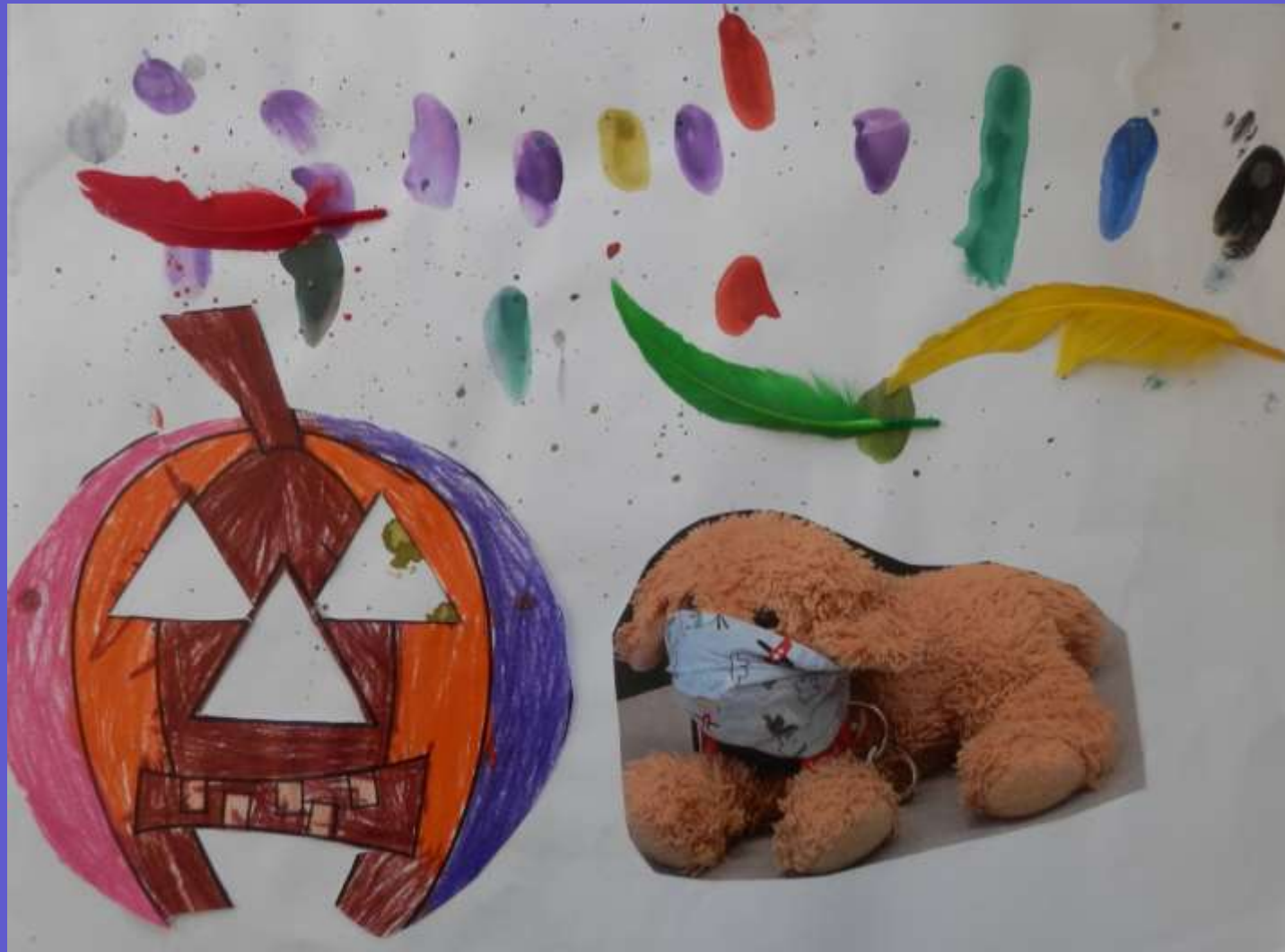
„Masken“ Maximilian Hoops (1. / 2. Klasse)